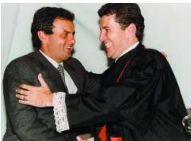
Jarbas Soares Júnior recebe os cumprimentos do Governador de Estado, Aécio Neves, durante cerimônia de posse, realizada na sede da Procuradoria Geral de Justiça

Fizemos um excelente trabalho sobre os Termos de Ajustamento de Conduta, conduzido pela procuradora regional da República, de São Paulo, Geisa Rodrigues. Este trabalho terá a divulgação que merece no Congresso do Rio de Janeiro e servirá, certamente, de orientação para o MP do Brasil. O