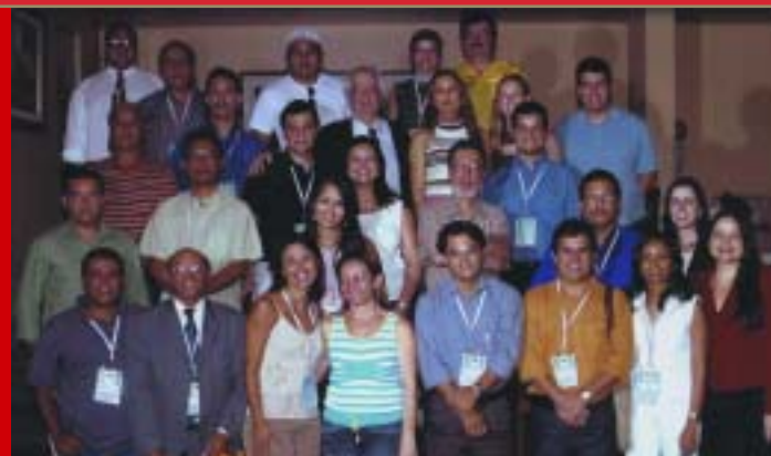
Participantes do encontro de promotores em Petrolina.

Em Sergipe, o Núcleo de Apoio às Promotorias do Rio São Francisco do Ministério Público do Estado realizou diversas atividades de fiscalização, monitoramento e revitalização do rio, durante todo o ano de 2004, e já elaborou um planejamento estratégico de atividades para 2005. Entre as atividades em andamento estão a restauração da mata ciliar e a revitalização de nascentes de afluentes.